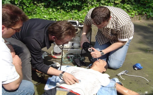
Rettungsassistentenausbildung in Vollzeitform